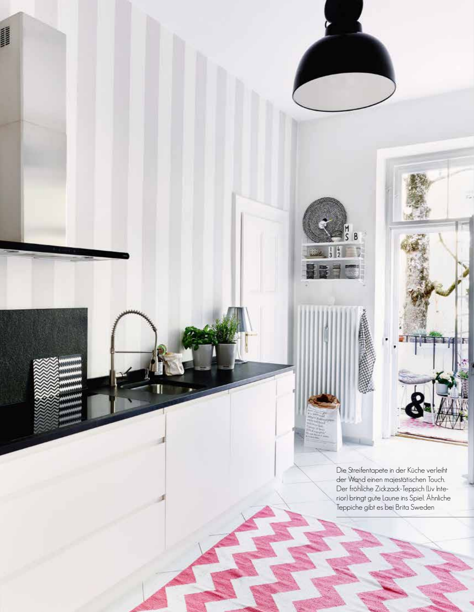
Die Streifentapete in der Küche verleiht der Wand einen majestätischen Touch. Der fröhliche Zickzack-Teppich (Liv Interior) bringt gute Laune ins Spiel. Ähnliche Teppiche gibt es bei Brita Sweden