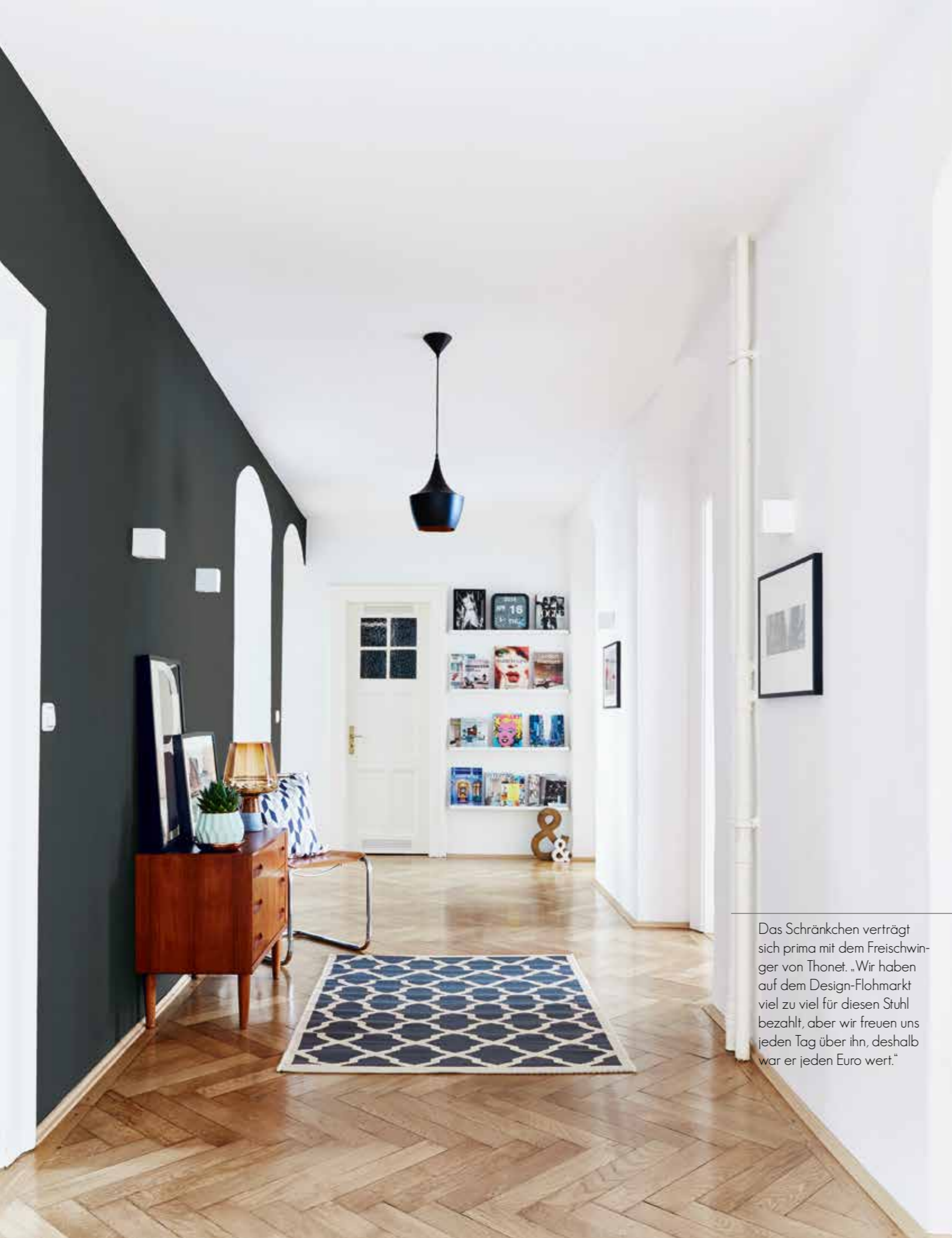
Das Schränkchen verträgt sich prima mit dem Freischwinger von Thonet. „Wir haben auf dem Design-Flohmarkt viel zu viel für diesen Stuhl bezahlt, aber wir freuen uns jeden Tag über ihn, deshalb war er jeden Euro wert.“