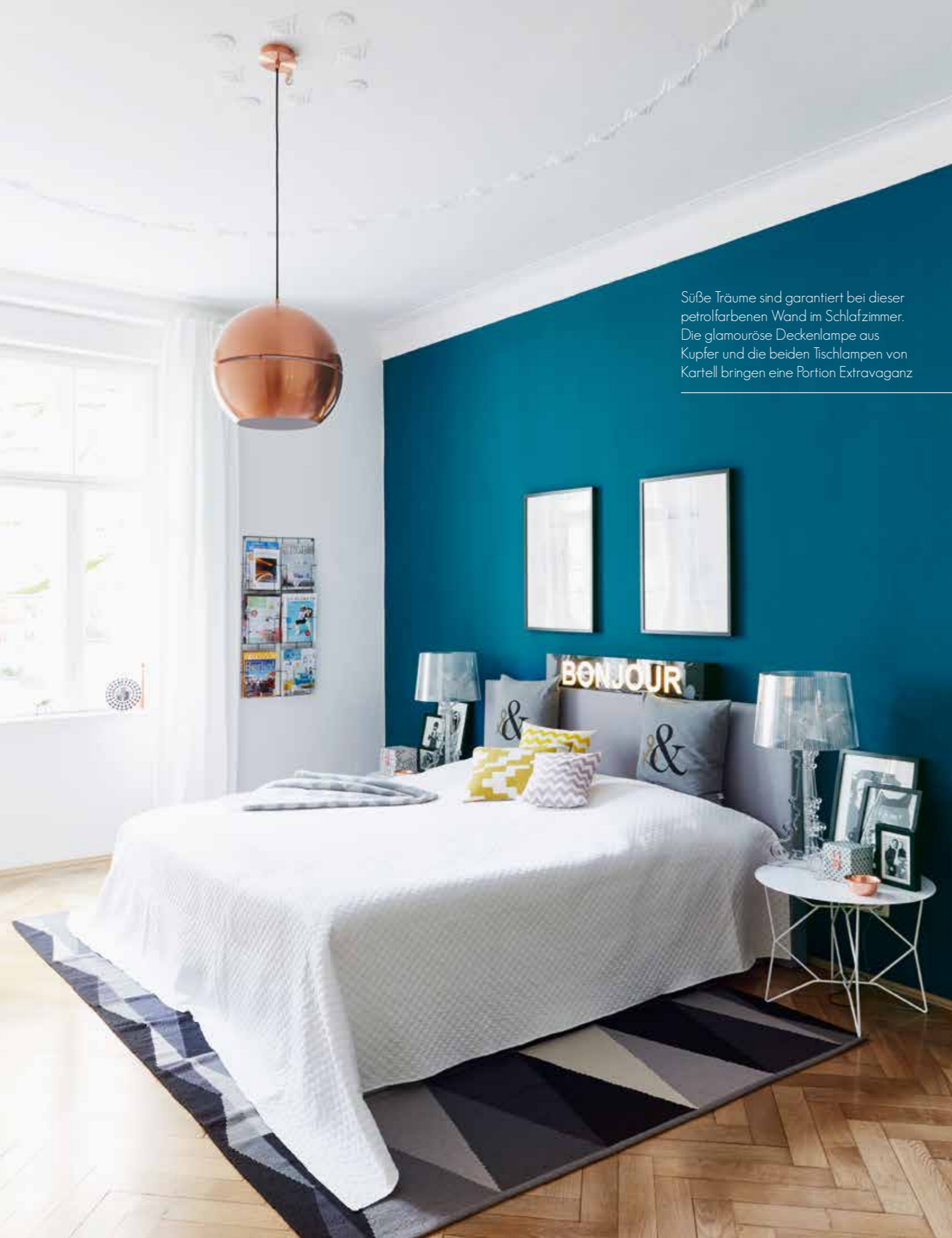
Süße Träume sind garantiert bei dieser petrolfarbenen Wand im Schlafzimmer. Die glamouröse Deckenlampe aus Kupfer und die beiden Tischlampen von Kartell bringen eine Portion Extravaganz

Text: Frederike Treu